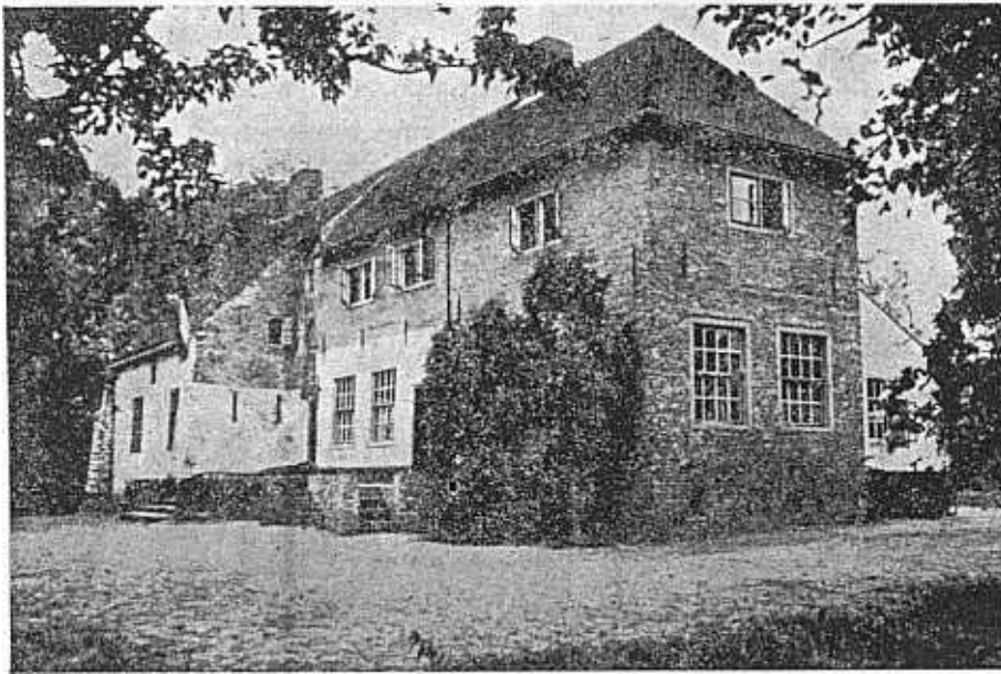
JEUGDHERBERG TE OOSTVOORNE

De jeugdherbergavond, die Donderdag 16 Februari j.l. in de filmzaal Maanweg werd gegeven, trok veel meer aandacht dan de kern zelf aanvankelijk durfde hopen. Vrijwel de gehele fabrieksjeugd was aanwezig om te horen wat de N.J.H.C. ons te vertellen had.