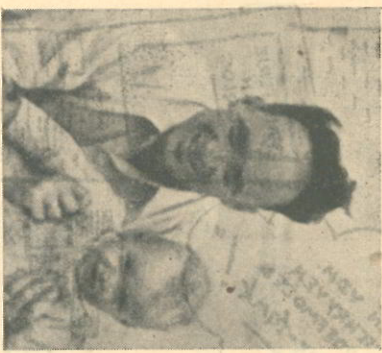
de jubilaris met jongste spruit

Wel, sedertdien is VDH gegroeid en dus hebben de werkzaamheden van deze afdeling een geweldige vlucht genomen. De inkoop Klees heeft deze groei geheel meegemaakt en mede mogelijk gemaakt door zijn taakver-