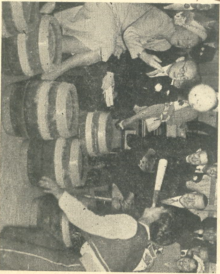
Een groot moment voor de jongleur uit het jongenscircus op de tentoonstelling „Jeugd van Nederland". Koningin Juliana werpt hem de bal toe.