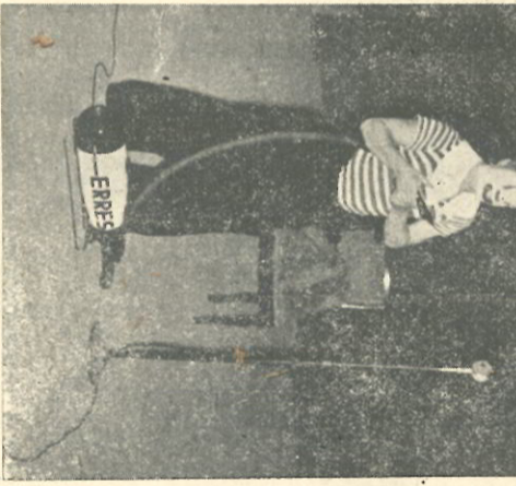
Fantasio, de muzikale clown, die het presteert om op alle mogelijke en onmogelijke instrumenten muziek te maken, demonstreert hier een ongedachte mogelijkheid van de ERRES strotzinger SZ 14. Denk niet dat het alleen maar bij deze gelegenheid een ERRES was, hij speelt er al jaren op!

Resultaat van het geheel: een geslaagde avond, een voldaan publiek, dat deze geste zeer gewaardeerd heeft en binnenkamers veel napret.