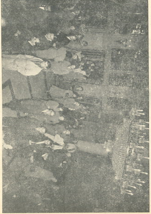
In de hal van het gebouw van K. en W. was het een vart-vient van bezoekers. Er was gerekend op 3.000 personen en daar zal het in feite wel niet ver van af zijn geweest, want de toeloop van enorm.