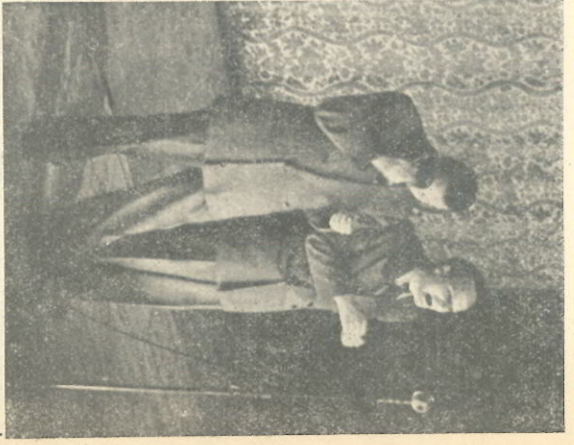
De twee Wama's zijn eigenlijk idiooten en al klinkt dat onvriendelijk, het is niet zo bedoeld. De mimiek van deze artiesten is ongelooflijk, vooral die van de man met de „ongestoffeerde“ barventulp, wiens ouders, naar zijn zeggen, volkomen normaal zijn. De zoons zijn dat zeker niet, doch ook hiermede bedoelen wij niets onvriendelijks.