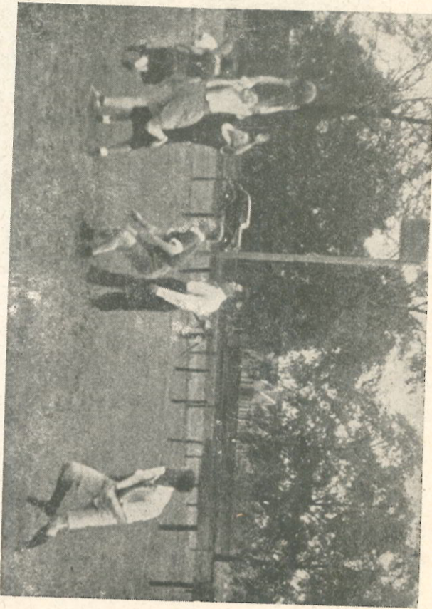
De verenigingscontributie verschilt eveneens vrijwel niets van voetbal en bedraagt pl.m. f. 1,— tot f. 1,25 per maand.

Kosten? De kosten voor het beoefenen van deze sport zijn vrijwel gelijk aan die van voetbal (in het eerste artikel besproken). Shirt, broekje of rok, en kousen zijn ook hier noodzakelijk, terwijl het schoeisel veelal uit gymnastiekschoenen bestaat. Er zijn echter ook speciale korfbalschoenen.