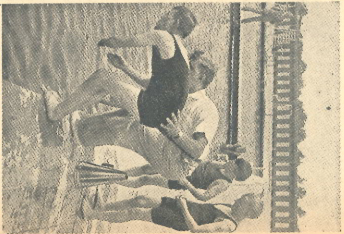
ZWEMMEN prachtige sport zie artikel op binnenspagina