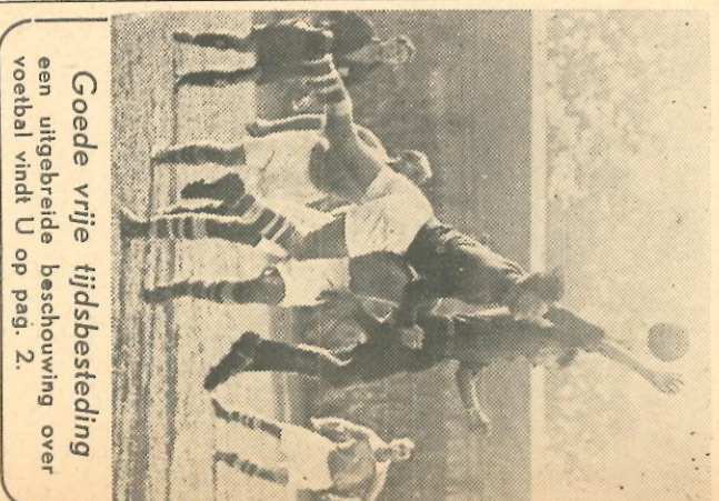
Goede vrije tijdsbesteding een uitgebreide beschouwing over voetbal vindt U op pag. 2.

Er wordt dus propaganda gemaakt voor de tbc-bridging en VDH doet daaraan mee, niet alleen door het inrichten van onze etalage aan de Parkweg, doch vooral door de vertoning van de prachtige film „Wit wint“. Hoewel deze film in de eerste plaats