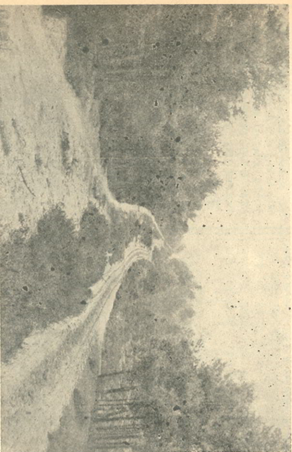
RIJWIELPAD VAN IMBOSCH NAAR EERBEEK

De mededeling in het VDH-tje, dat er onder gunstige voorwaarden een week vakantie in Eerbeek kan worden doorgebracht, zal door velen met vreugde zijn begroet. Ongetwijfeld zullen ook velen zich hebben afgevraagd: Eerbeek, ja, da's ergens op de Veluwe, maar is dat nou wel wat? Schrijver dezes, die z'n vacaties jaren lang op Noord- en Zuid-Veluwe heeft doorgebracht, zal er iets meer van vertellen. Eerbeek ligt in het Zuid-Oost gedeelte van de Veluwe, het gedeelte dat gevormd wordt door de driehoek Apeldoorn—Dieren—Arnhem, en is niet het drukst bezochte (maar dat is een voordeel) maar zeker het mooiste deel van de Veluwe.