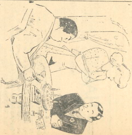
De spreker. Deze ging door.

"Zei je schrap, jongen", spottte Dirk. "Welnu, wat jullie fout is?" ging zijn vrouw verder. "Die Kern is best. Ik heb er VDH-tje minstens zo goed als hij. Die Kern, zeg ik, is best. Die moet er zijn. Maar die Kern is alleen goed, als de lui, die er in zitten, goed zijn."