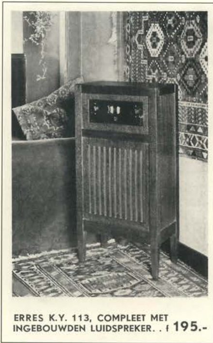
ERRES K.Y. 113, COMPLEET MET INGEBOUWDE LIJDSPREKER. . f 195.-

luidspreker type 2055 met bolvormige ticonal-magneet, een model dat slechts kort in productie is geweest. Zie ook brochure 9603. 8