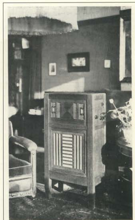
ERRES K.Y. 112, EEN VIER-LAMPSWISSELSTROOM TOESTEL MET INGEBOUWDE ELECTRO-DYNAMISCHEN LUIDSPREKER f 325,-.

Het vermoeden bestaat, dat van de bovengenoemde Erres toestellen slechts enkele tientallen tot honderdtallen per type zijn gebouwd. Deze typen zijn dan ook bij radioverzamelaars vrijwel onbekend en slechts sporadisch komt er een te voorschijn. Zo ook de hier beschreven KY 112, welke geen echt chassisnummer bezit, maar slechts een met de hand geschreven nummer 15 in blauw potlood op het chassis van het plaatstroomapparaat. Wanneer we de datumstempels op de condensatorblokken bestuderen, zien we dat deze liggen tussen 12 juni en 9 november 1931. Het moet er in de fabriekshal in Den Haag rond die tijd stil zijn geweest.