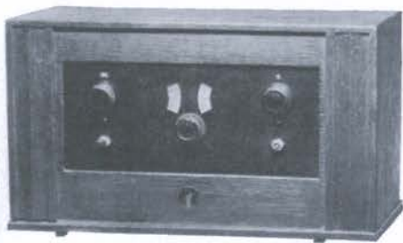
Een ERRES-radio rond 1930.

Van R.S. Stokvis Maastricht ontvingen wij een apparaat, dat volgens het opschrift van de overigens wel betrouwbare fabrikant een ERRES radio was.