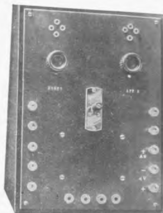
Versterker ERRES F

Apparaat Erres E heeft 10-voudige versterking en past geheel als aansluiting op de apparaten Erres A, B, C en D.