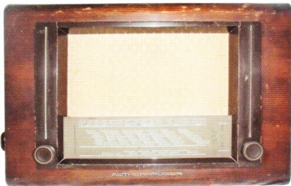
Aetherkruiser AK1412, uit 1941, waarvan 250 stuks geleverd zijn aan de Nederlandse handel en een gelijk aantal aan het Duitse Ostspende-project.

Het type KY415 is ontwikkeld met de bedoeling het aantal lampen tot een minimum terug te brengen, zonder daarbij afbreuk te doen aan de goede werking van het toestel. De KY415 telt naast de gelijkrichtbuis 1823 dan ook maar twee andere lampen (ECH3 en EBL1).