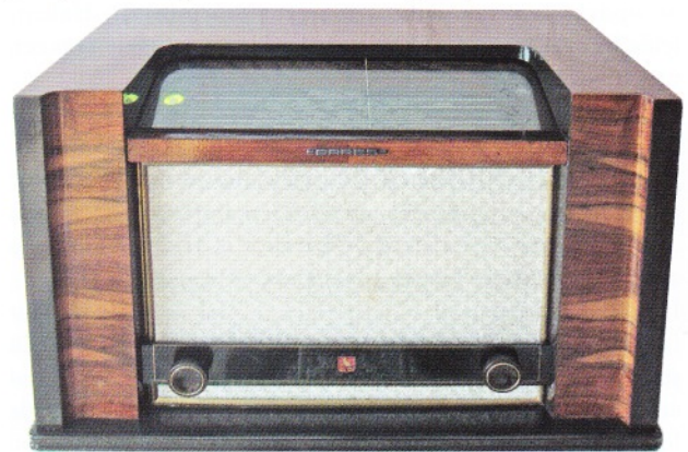
Erres KY418, gebouwd in 1942 na de afkondiging van het verkoopverbod van december 1941. De gehele productie van bijna 1500 stuks is geleverd aan het Ostspendeproject. Het toestel is dan ook een zeldzame verschijning in Nederlandse verzamelingen.

In 1942 maakt het bedrijf Haghefilm een bedrijfsfilm voor Van der Heem met de titel "In Holland staat een huis" [3]. De film is vrijwel geheel aan de productie van radiotoestellen gewijd. De eerste vertoning aan het personeel vindt plaats in december 1942 in het City-theater in Den Haag. In deze film is onder andere de productie van de KY418 te zien. De beelden daarvan moeten evenwel al in de eerste helft van het jaar gemaakt zijn, toen de KY418 nog in productie was.