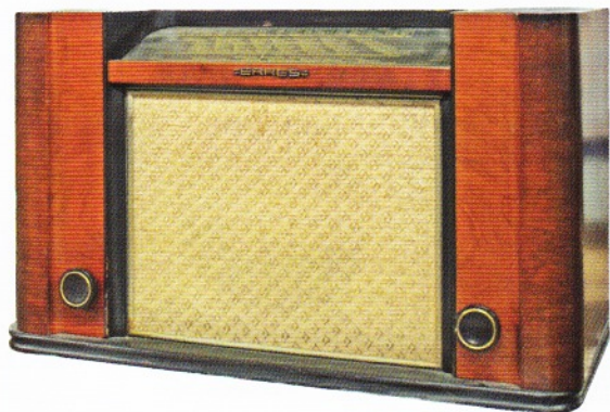
Erres KY417 gebouwd in 1941/1942 en zowel geleverd aan de Nederlandse handel als aan het Ostspende-project. Is uitgerust met kortegolf, middengolf en langegolf, maar biedt tevens de mogelijkheid met de golflengteschakelaar twee vast ingestelde stations te kiezen (op de fabriek voorafgestemd op Hilversum I en II). Collectie: Rotterdams Radio Museum.

Rond 10 november wordt de Nederlandse radiohandel geconfronteerd met het Ostspende-project van Joseph Goebbels, de Duitse minister voor Volksaufklärung und Propaganda . Voor het Oostfront heeft hij 80.000 radiotoestellen nodig, waarmee de daar aanwezige manschappen naar de radio-uitzendingen uit het moederland kunnen luisteren. De Duitse industrie kan echter geen radiotoestellen voor de ontvangst van de gewone omroepers leveren, omdat de bedrijfstak volledig is ingesteld op productie voor oorlogsvoering. Daarom wordt besloten de benodigde toestellen in het bezette westen te verwerven. Als eerste stap moeten alle Nederlandse radiohandelaren hun voorraad radiotoestellen (tegen betaling) afstaan. Dat betekent dat alle pas door Van der Heem uitgeleverde Erres-toestellen (maar ook de toestellen van alle andere merken) in één keer uitverkocht zijn. Zo is een grote radiohandel in Delft in één keer door zijn hele voorraad van 57 toestellen van het type KY415, KY416 en KY417 heen.