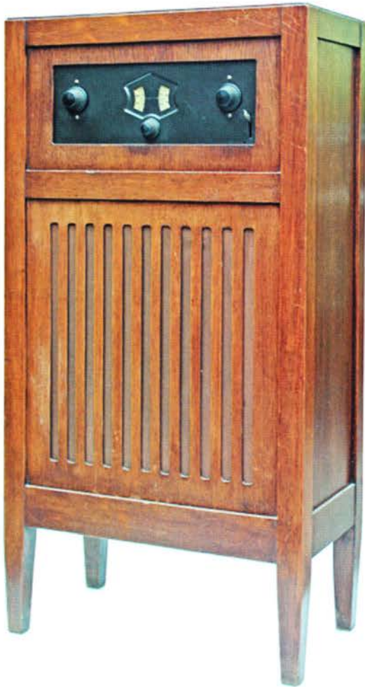
KY113 uit de collectie van het Radiomuseum Overpelt.

Beide toestellen zijn uitgerust met de lampen E424, E452T, C443 en 506 en geschikt voor ontvangst op de middengolf en de langegolf. Van de KY111 zijn nu drie exemplaren, van de KY113 twee exemplaren bekend.