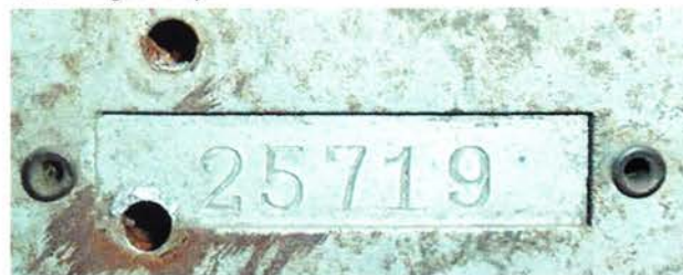
Het serienummer 25.719 op het chassis van een toestel, waarvan lange tijd werd aangenomen dat het een KY108 zou zijn, maar dat waarschijnlijk de zeldzame KY110 is.

Voor het onderzoek naar vooroorlogse Erres-toestellen van de eerste auteur zijn in totaal 13 stuks KY108 aangemeld. Daarvan hebben 12 toestellen een serienummer in het bereik 81.100 tot 85.600. Er is echter al geruime tijd een chassis bekend met het afwijkende serienummer 25.719, waarvan tot voor kort werd aangenomen dat het van een KY108 afkomstig zou zijn.