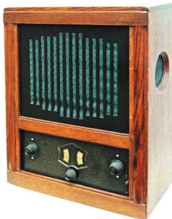
Het afgebeelde toestel is een KY108 (uit de collectie van het Radio Amateur Museum in Reusel), maar uiterlijk zou het ook voor een KY110 kunnen doorgaan.

Een KY110 zou daarom ook gemakkelijk voor een KY108 aangezien kunnen worden.