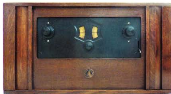
KY111 (collectie John Koster).

Bij de KY111 en KY113 is gebruik gemaakt van dezelfde schakeling, die veel overeenkomst vertoont met die van de KY108. Net als de KY108 zijn het ook 4-lamps wisselstroomtoestellen. Het metalen front is gelijk aan dat van de KY108 en vertoont dezelfde verdieping rondom de afstemschalen. De KY111 is een tafelmeubel, zonder luidspreker, terwijl de KY113 een hoog, staand meubel is met ingebouwde luidspreker.