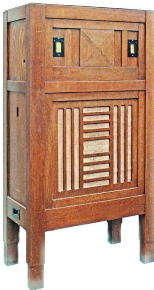
KY112 uit de collectie van het Radio Amateur Museum in Reusel.

Ook de KY112 is eerder in een bijlage bij het RHT besproken [3].