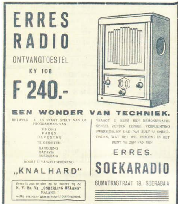
Advertentie van Soekaradio in Soerabaja voor de Erres KY108 in "De Indische Courant" van 13 juni 1933.

Op kleine schaal werd de kortegolfontvanger Erres K.I.5 in Indië gebruikt, maar het toestel bleek niet erg succesvol. Pas in 1932 werd Stokvis echt actief in Nederlands-Indië met de introductie van de wisselstroomontvanger KY108. Tot dan werd nog voornamelijk geluisterd met batterijtoestellen.