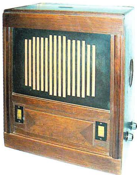
KY109 van onbekende herkomst.

In de KY109 en KY112 wordt dezelfde schakeling toegepast, maar de chassis zijn in verschillende kasten gebouwd, bij de KY109 in een tafelmeubel, bij de KY112 in een hoog, staand meubel. Ook de KY109 en KY112 zijn wisselstroomtoestellen, maar voorzien van 5 Philips-lampen, met weer de 506 als gelijkrichter.