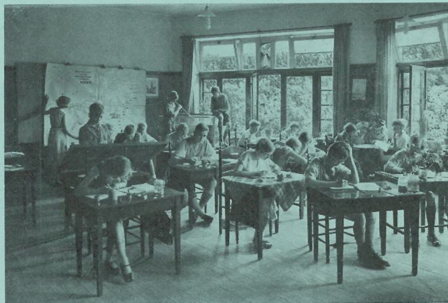
Een klaslokaal van de Pallas Atheneschool te Amersfoort waar men opmerkelijke resultaten behaalde met het nieuwe systeem

De cultuurvorming gaat uit van die kleine groep van begaafden, eventueel nog vermeerderd met de besten uit de groep der vluggen. In het nieuwe onderwijssysteem, of liever opvoedingssysteem legt men het erop aan, dat de kinderen reeds op school beginnen met hun menselijke deugden tot ontwikkeling en in toepassing te brengen. Met andere woorden, zij mogen elkaar helpen. Dit laatste is een reactie op het bekende: Foei Jantje, je mag Pietje niet voorzeggen.