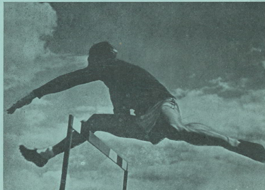
met reuzenschreden vooruit FOREST TOWNS, U.S.A. wereldrecordhouder 110 m hordenloop stapt over een 1,10 m hoge hindernis. 110 m in 14,3 seconde

In de atletiek vinden alle beoefenaren van wintersporten de ideale zomertraining, vinden alle niet-sportbeoefenaren een prachtige gelegenheid om de slechte invloeden van de dagelijkse werkring op te heffen.