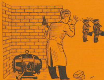
MATERIAAL DOOK ONDER

Het is niet nodig al de verschrikkelijke herinneringen aan de afgelopen barre winter nog eens op te halen. Wij zaten niet stil want onze directie werd belast met de regionale leiding voor de massavoeding in 's-Gravenhage, Voorburg, Rijswijk en Leidschendam. Dat wil zeggen dat wij de baas werden over alle centrale keukens. Daardoor is weer heel wat leven in de brouwerij gekomen want de directie maakte op grote schaal gebruik van eigen personeel. Het is zelfs zover gekomen dat VDH zelf een keuken is gaan exploiteren in het Slachthuis. En al hadden wij helemaal geen verstand van eten koken, de mensen die aan de keukens werkten deden dit onder leiding van prima koks met zoveel toewijding, dat onze eigen keukens een der beste van heel Den Haag werd en het bracht tot een productie van tienduizenden liters voedsel per dag.