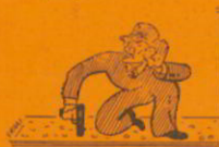
HET RISICO TE LOPEN EEN SD-MAN OP ONS DAK TE KRUGEN

Dat neemt niet weg dat deze Omroep voor ons een historisch nummer is, omdat het nu voor de eerste maal is dat wij weer eens ronduit kunnen spreken zonder het risico te lopen een SD- of NAF-man op ons dak te krijgen. En daar een historisch nummer nu eenmaal historie behoort te bevatten zullen wij het een en ander ophalen over de geschiedenis van Van der Heem N.V. gedurende de bezettingstijd. Dus een journaal van ons bedrijf gedurende de afgelopen jaren.