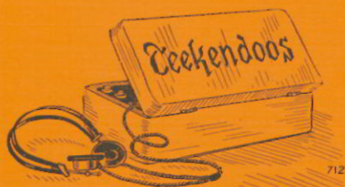
UITERLIJK EEN TEKENDOOS

omvormer werd echter spoedig uitgeleend aan een luisterpost van één onzer illegale bladen en we moesten dus naar een andere oplossing zoeken. Die staat hier nu voor ons. Een klein doosje, uiterlijk een tekendoos zonder iets, dat op de inhoud duidt. Eenmaal geopend komen aansluitnoeren, antenne, aardleiding, koptelefoon en het complete ontvangtoestel aan het licht. Het apparaat bevat een tweevoudige radiolamp en behoeft dus elektrische voeding. En nu komt het aardigste, deze kan zowel verkregen worden uit een accu en anodebatterij, als wel uit een gewone rijwiël-dynamo, zoals deze op een fiets voor de verlichting aanwezig is. Even de fiets op zijn kop, met de hand de trapper in matig tempo rondbewegen en..... „hier is Londen, allereerst hoort U het voornaamste nieuws“..... Die avond ging het niet per fiets, we zijn eens niet zuinig en niet voorzichtig, want we gebruiken versterker en luidspreker.