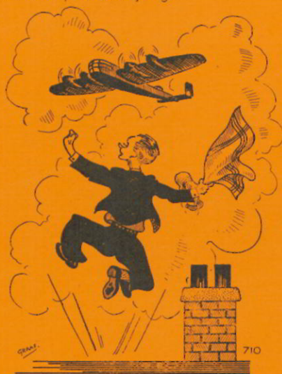
ENFIN TOEN DE NOOD MET HOOGST STEEG . . .

Enfin, toen de nood op zijn hoogst steeg kwamen de voedselbombardementen en kort daarop de bevrijding.