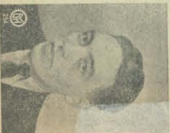
J. Brill Technische Dienst 4 Mei