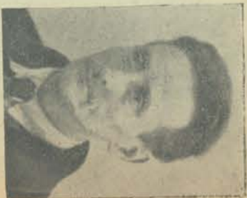
D. A. Munnik Machinale Houtbewerking 7 April