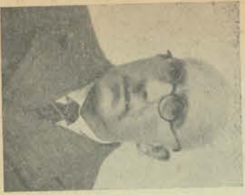
J. W. Willemsen Montage-magazijn 1 Februari