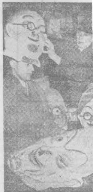
In Januari beginnen de opscheffingen. Het uitzoeken van een passende „kop“ is een lastig karwei.

Dank zij de uitstekende sociale voorzieningen van het duizenden man tellende personeel is Van der Heem N.V., de „deviezen-kwekerij“ onder de Haagse rook, uitgegroeid tot een model-bedrijf in optima-forma.